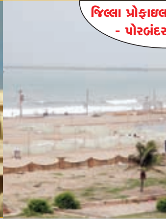
જિલ્લા પ્રોફાઇલ - પોરબંદર