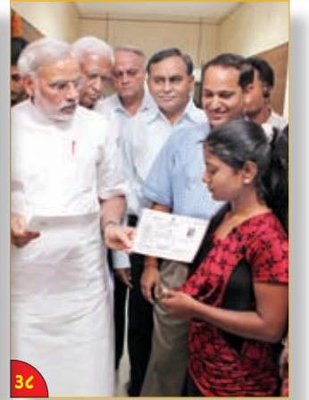
જિલ્લા પ્રોફાઇલ - ખેડા